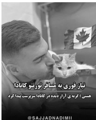
شکل ۲. یک نمونه تصویر فرسته

... اینکه در عصر تکنولوژی و اطلاعات در دنیا همچنان بسیاری از مردم در ایران تنها تفریحشان حیوان آزاری است جای سرافکندگی و تأسف دارد... کاش روزی این مملکت از این تاریکی وحشتناک نجات پیدا کند.