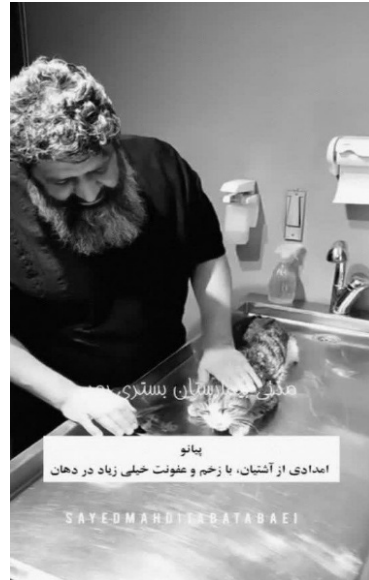
شکل ۳. یک سگ امداد شده شکل