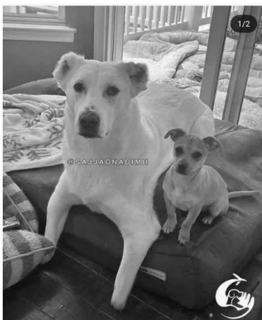
شکل ۱. سگ آزاردیده

هر چهار دست‌وپایش را قطع کرده‌اند و او پس از امداد و تلاش‌های ندیمی، به فردی حیوان‌دوست در امریکا واگذار شده است. در روایت ندیمی، ایران با تمام ماجرای غم‌انگیزش اکنون در خانه جدید خود، مادری برای توله‌های کوچک صاحب‌خانه شده که به سمت او پناه می‌برند و همین موضوع که در قالب فیلم و عکس مشاهده می‌کنیم موجب برانگیختن عواطف انسانی بیننده نسبت به ایران می‌شود. حامیان ایران با قرار دادن «پروتزهای کمکی پا» سعی می‌کنند تا در ایستادن و حرکت دادن او کمک‌ش کنند؛ سرانجام، ایران را در وضعیتی مشاهده می‌کنیم که یک زندگی آرام، محبت‌آمیز و انسانی را تجربه می‌کند.