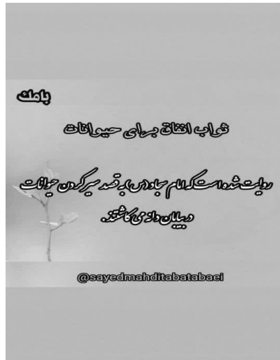
شکل ۵. یک نمونه داستان

یک بخش قابل توجه دیگر، بازخوردها و کنش‌های مخاطبان صفحه است که به صورت یک کنش جمعی و همدلانه در قالب هشتگ «سفیر مهربانی» در کمک به حیوانات با او همراه شده‌اند. «بازاریابی در حوزه خیریه به گونه‌ای تکامل یافته که علاوه بر جلب مشارکت مالی، به ایجاد پیوندهای عاطفی و افزایش حس مسئولیت اجتماعی در افراد کمک کند». در حقیقت، به جای فروش مستقیم یک کالا، یک ایده اجتماعی یا هدف خیرخواهانه عرضه می‌شود (وفایی‌نیکو و بهار، ۱۴۰۴: ۱۵۴). این سرمایه اجتماعی که با شکل‌گیری تعامل اتفاق افتاده، هم در فضای واقعی و هم دیجیتالی، سرمایه نمادین طباطبایی را به عنوان یک حامی مهربان و روحانی دلسوز و حقیقی افزایش داده است.